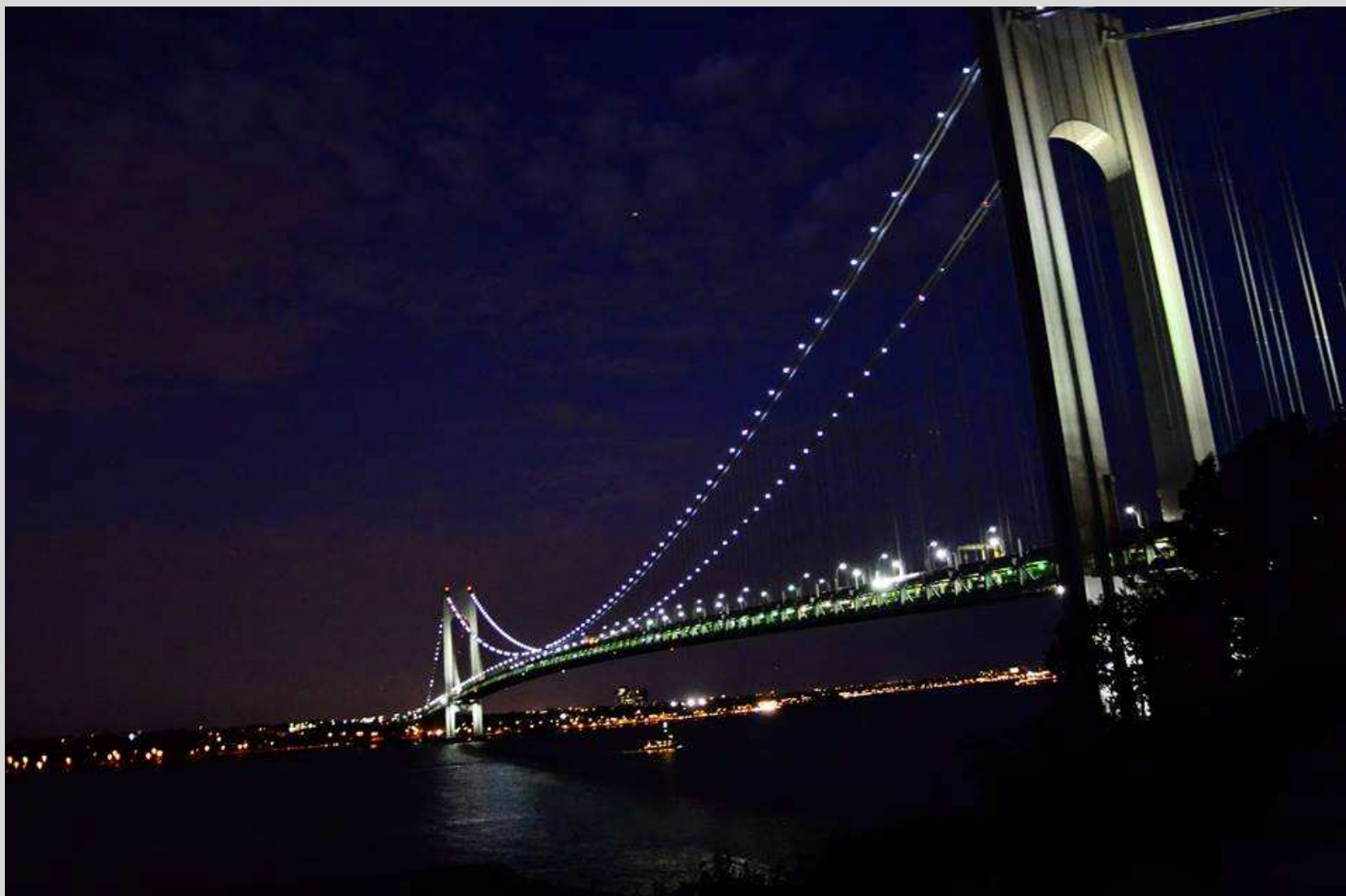
I miejsce – (Fot. Paulina Pencak kl. I A)