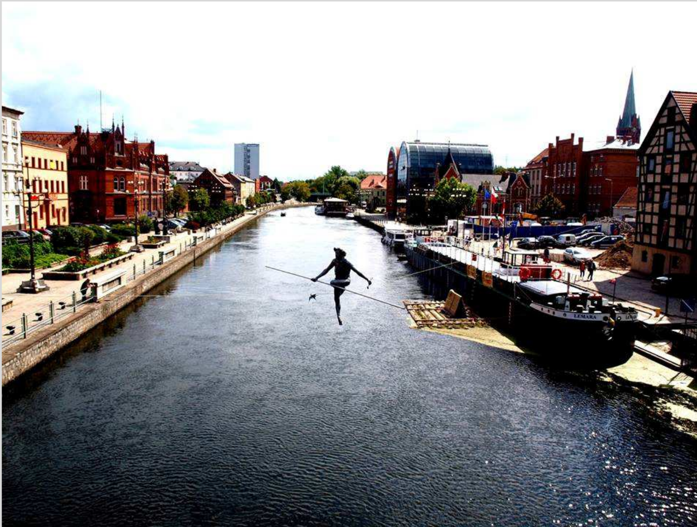
II miejsce – (Fot. Patrycja Obszyńska kl. III g A)